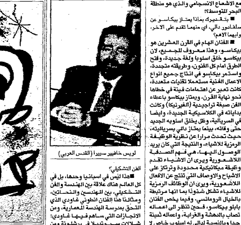
لويس خافيير سيبيرا (القديس العربي)

■ لكن لا تنتسقل هذه الفنون مع التكنولوجيا بطريقة مشوهة أو مموخحة بعيدا عن الجذليات؟